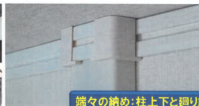
端々の納め:柱上下と廻り縁