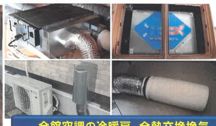
全館空調の冷暖房、全熱交換換気