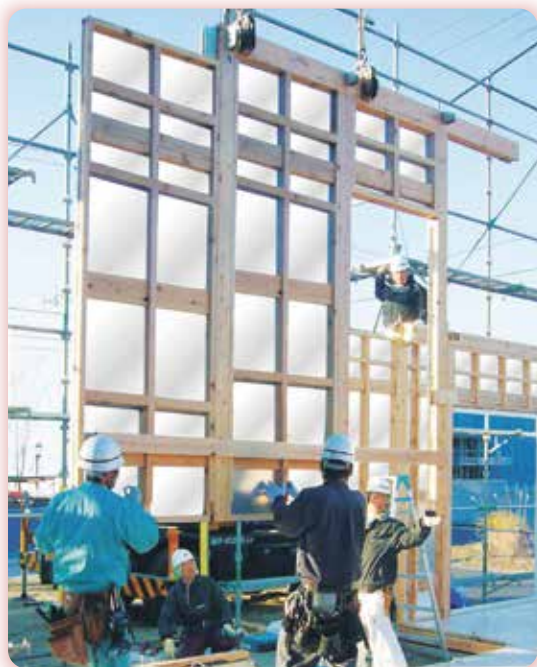
スモリの家 銀我パネル