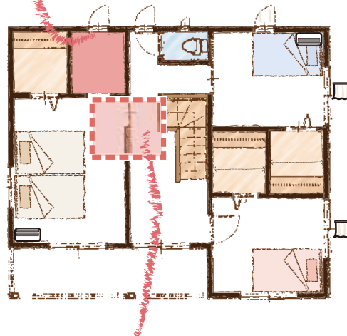
小屋裏は子供達の秘密基地♪