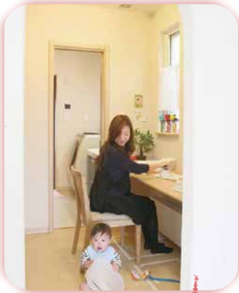
ママも心安らく家事室