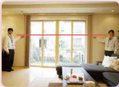
スモリ 正直な家 エコノハ展示場

エコノハ展示場が約2mの津波被害を受けましたが展示場の中へ水は入りませんでした。